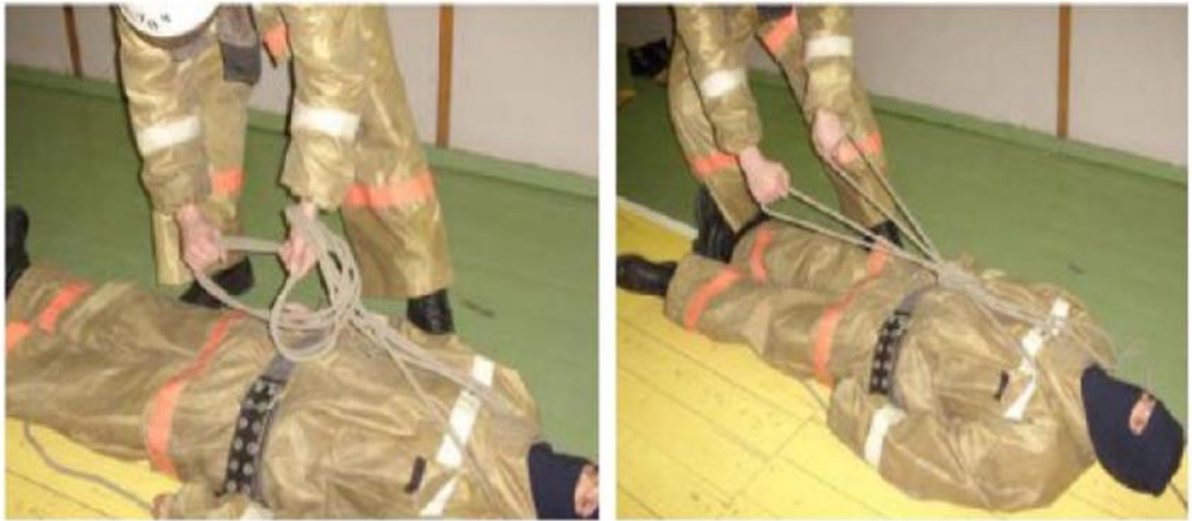
Рис. 29, 30

Коротким концом веревки обвязывает спасаемого по талии (Рис.31) и надежно его закрепляет на двойной спасательной петле (Рис. 32). Затем пожарный берет в левую руку длинный конец веревки и прикладывает его к карабину с внешней стороны, открывает замок карабина, а правой рукой, вращательным движением от себя, делает два витка. Закрывает замок карабина. После чего веревку, идущую от спасаемого берет в левую руку, а длинный конец проводит за спиной и удерживает его в правой руке (Рис. 33).