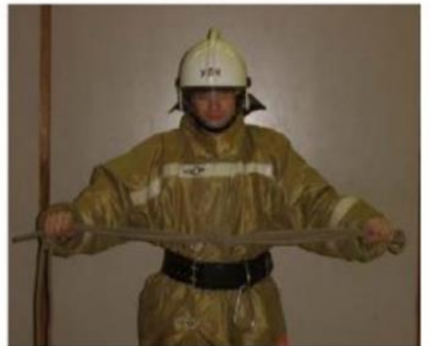
Рис. 22, 23

Концы веревки и одинарную петлю держит в правой руке, а двойную петлю в левой (Рис. 20). Кладет двойную петлю на предплечье правой руки (Рис, 21), пропускает левую руку через концы веревок, удерживаемых правой рукой и находящихся па предплечье правой руки, берет левой рукой двойную петлю (Рис. 22), протягивает ее вместе с правой рукой обратно и затягивает узел (Рис. 23).