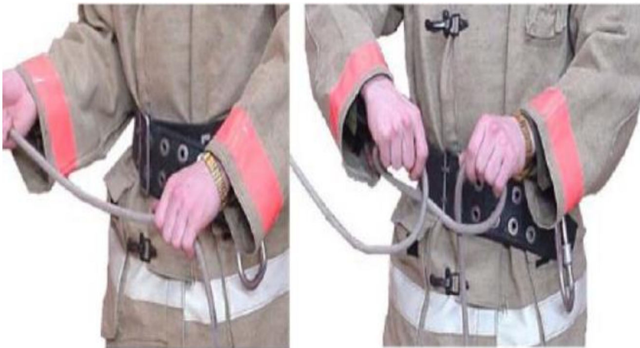
Рис. 45 Рис. 46

Для вязки узла взять веревку в левую руку (ладонью вверх), в правую руку (ладонью вниз) на расстоянии 25-30 см от левой руки (Рис. 45). Сделать две петли вращательным движением кистей рук по часовой стрелке (Рис. 46), сложить их вместе, перекладывая из левой руки в правую (Рис. 47). Надеть петли на рукав у соединительной головки и затянуть. Затем протянуть верхний конец веревки вдоль ствола (шанцевого инструмента) к спрыску, сделать петлю (Рис. 48), надеть ее на ствол (шанцевый инструмент) и затянуть верхним концом веревки (Рис. 49). Сообщить Пожарному №1 «Готово»