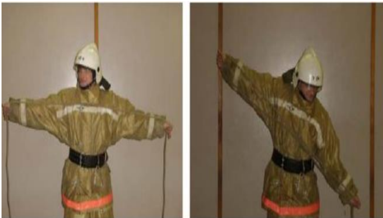
Рис. 18, Рис. 19

Пожарный вынимает из середины клубка конец веревки и делает три отмера в левую сторону на длину разведенных в стороны рук (Рис. 18). Складывает отмеренную веревку вдвое (Рис 19), а затем вчетверо.