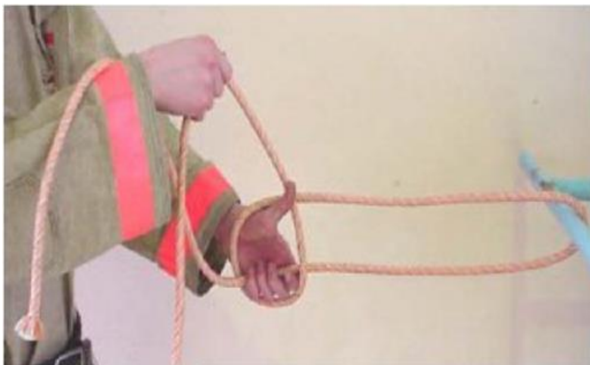
Рис. 1 1

Пожарный обматывает одним-двумя витками веревки конструкцию, берет короткий конец в левую руку. длинный - в правую. Правой рукой накладывает и обматывает длинным концом веревки кисть левой руки, второй виток накладывает на большой палец левой руки (Рис 11). Поворотом большого пальца влево выводит длинный конец веревки между веревками, идущими от конструкции, образует петлю, в которую указательным и большим пальцами правой руки подает петлю короткого конца веревки, и затягивает узел (Рис 12, 13)