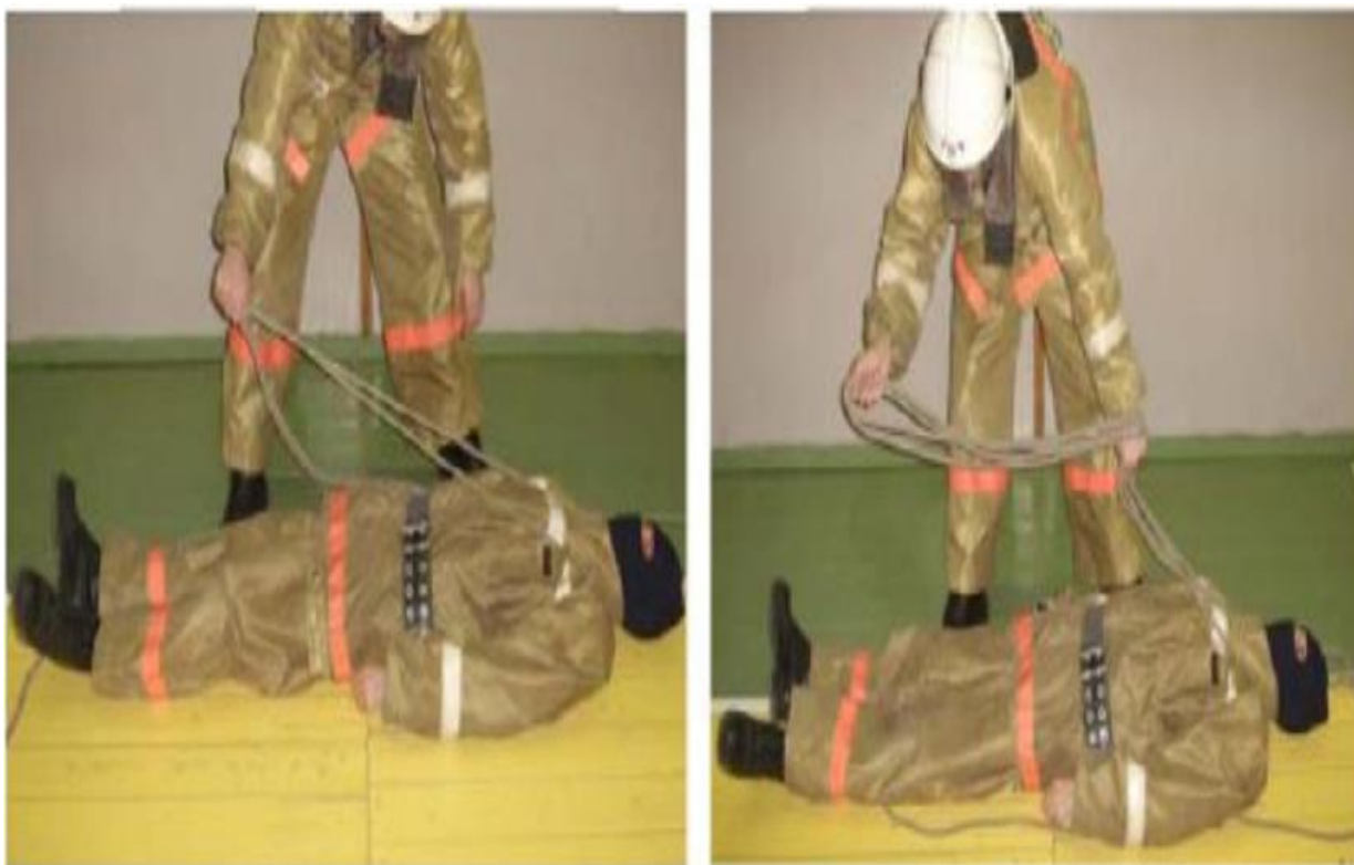
Рис. 27, 28

Пожарный стоит с правой стороны от спасаемого, вынимает из середины клубка конец веревки и делает вправо три отмера на длину разведенных в стороны рук. При этом отмеренная веревка остается в левой руке. Правой рукой складывает веревку вдвое, образуя петлю, одевает ее через голову на шею спасаемого. Взяв в правую руку длинный и короткий концы веревки, доводит ее до колен спасаемого, определив необходимое количество веревки для вязки петли (Рис. 27). Обратным движением левой руки складывает веревку в четверо и доводит ее до верхней части груди (Рис. 28). Вращает левой рукой против часовой стрелки, при этом обведя в четверо сложенную веревку сверху вниз. Из правой руки перекладывает удерживаемые две петли в левую (Рис. 29) и завязывает их на груди спасаемого (Рис. 30). Связанные две петли надевает на каждую ногу.