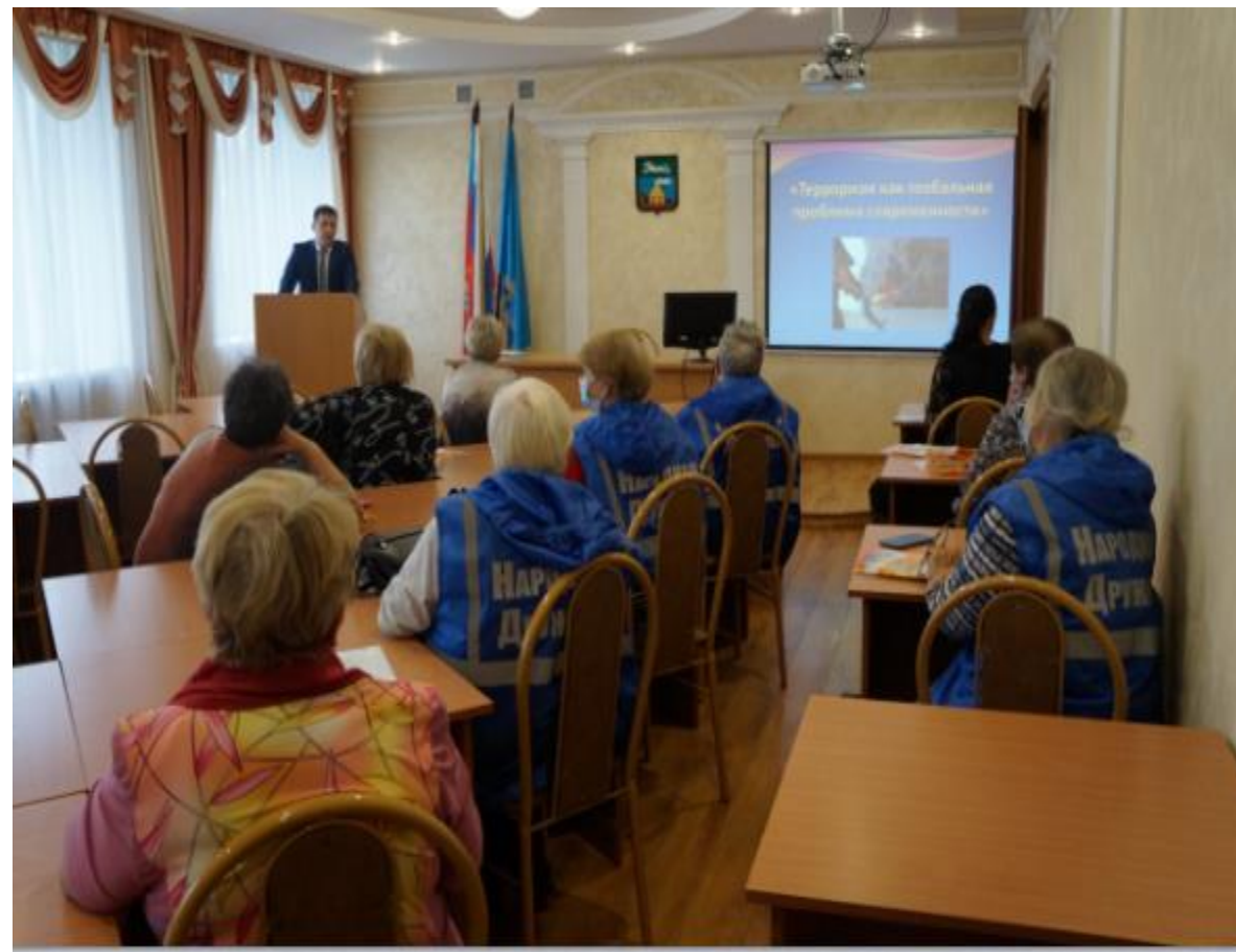
УКП ГО Ленинского района, г. Барнаул Занятия с «Народной дружиной» с привлечением сотрудников полиции и специалистов ГОЧС